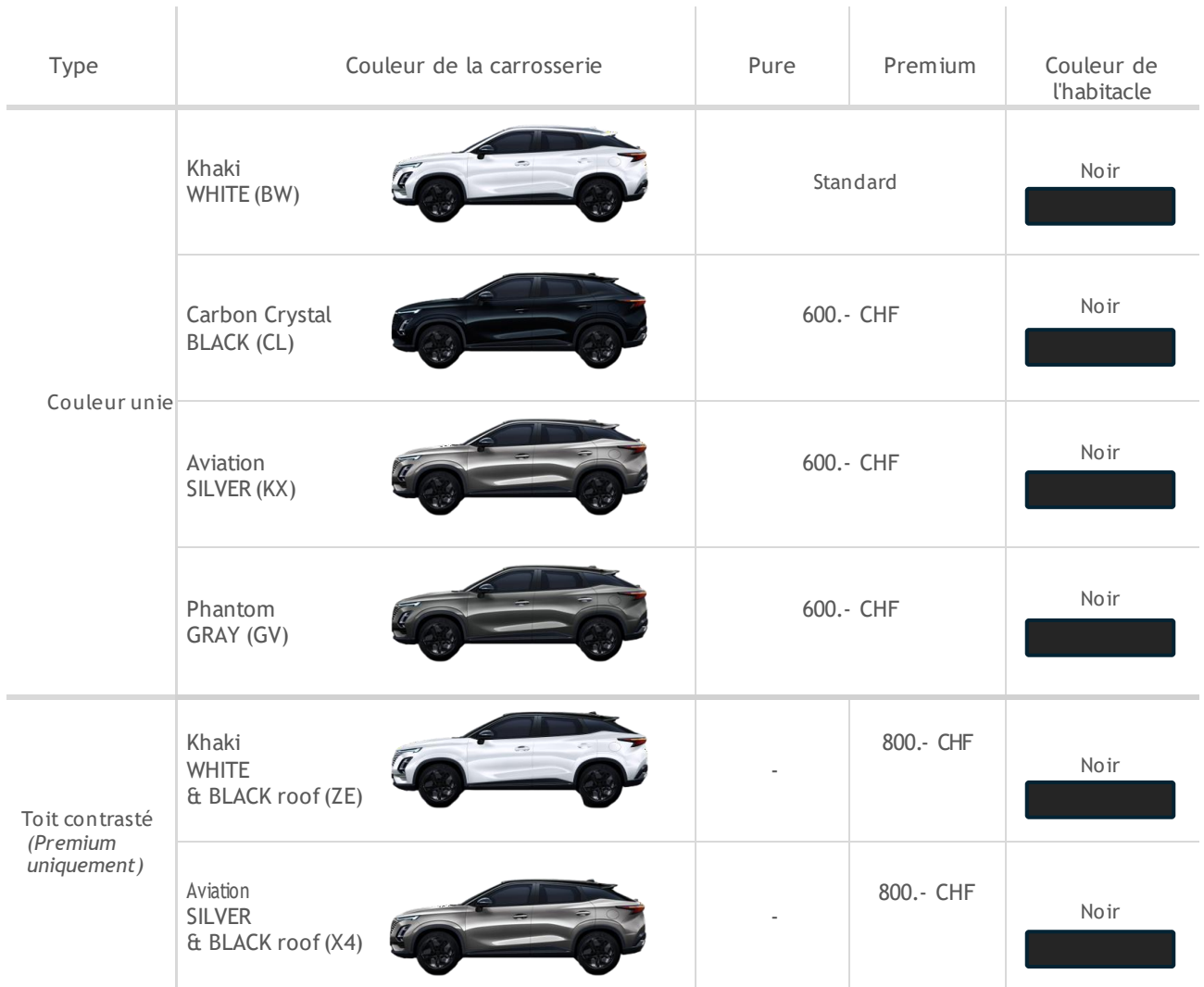
Couleur de l'habitacle Noir